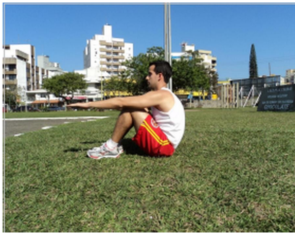
Foto 15: Posição Inicial e Final (Posição “Um”) - Visão Lateral Foto 16: Posição “Dois” - Visão Lateral